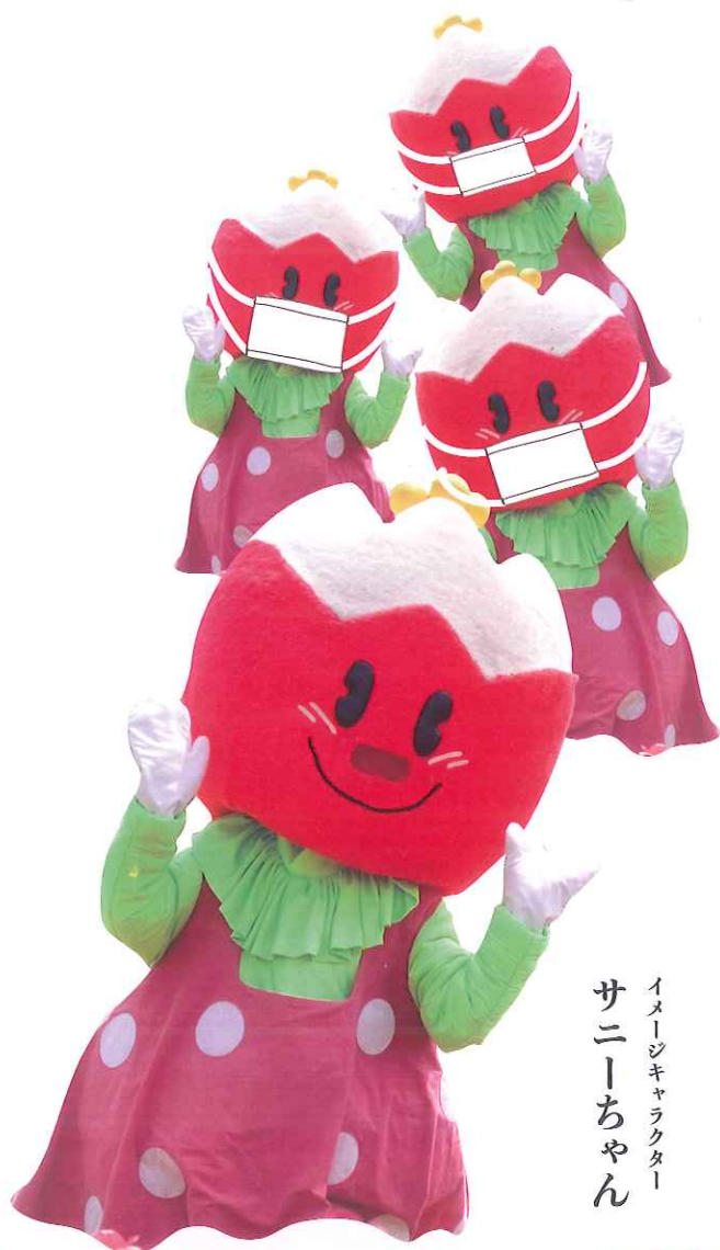
イメージキャラクター サニーちゃん